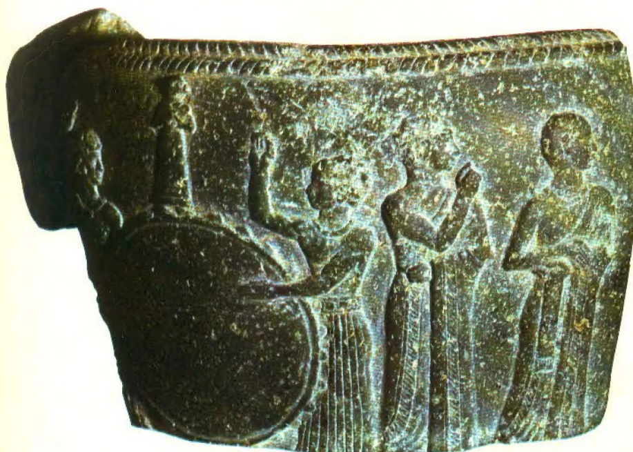
Ceremonia de culto de fines del III milenio (Museo del Louvre, París). Mientras dos sacerdotes avanzan, otros dos batan una especie de tambor sobre el que se yergue la figura de un dios.